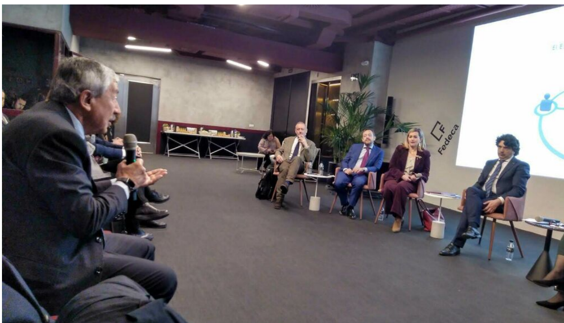
Altos funcionarios del Estado piden desarrollar el Estatuto Básico del Directivo Público Fedeca

Lo solicitan debido a la "pérdida de eficacia" que sufre la Administración Pública al no estar dirigida por los mejores en términos de eficacia