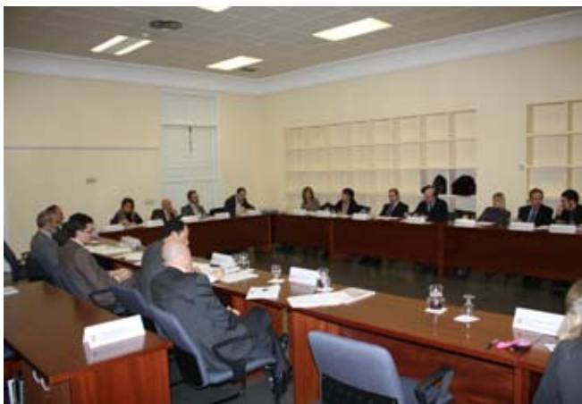
Asistentes a la Reunión de Escuelas e Institutos de Administración Pública españoles

En cuanto a la identificación y discusión de problemas funcionales y de gestión de carácter común, se abordó, por el Director del INAP, la restricción a las posibilidades de realizar convenios de colaboración para la formación con Universidades y organismos públicos, derivadas de Ley 30/2007, de 30 de octubre, de Contratos del Sector público y su art.4.1c). Las intervenciones de los asistentes pusieron de manifiesto que estos problemas no son comunes a todas las administraciones y algunos de ellos indicaron que no tienen dificultades jurídicas para trabajar con universidades mediante convenios.