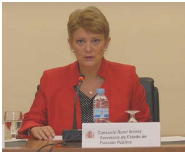
Consuelo Rumí Ibáñez, Secretaria de Estado para la Función Pública

Como Secretaria de Estado para la Función Pública, quiero en primer lugar saludar con satisfacción la aparición de este nuevo “Boletín de Función Pública”, que se inscribe en el marco del impulso para alcanzar cotas cada vez más altas de excelencia en la actividad del Instituto Nacional de Administración Pública. Espero que esta publicación electrónica tenga una larga y fructífera vida, y se convierta poco a poco en foro y vehículo de conocimiento, información y debate en torno a los diferentes aspectos del empleo público.